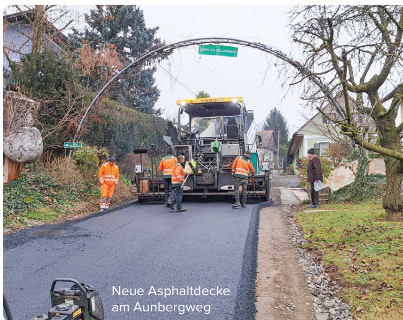
Neue Asphaltdecke am Aunbergweg

Unser Marktplatz wird heuer von einem prächtig geschmückten Christbaum erhellt. Vielen Dank an Familie Pintäritsch aus Pichla für die großzügige Spende!